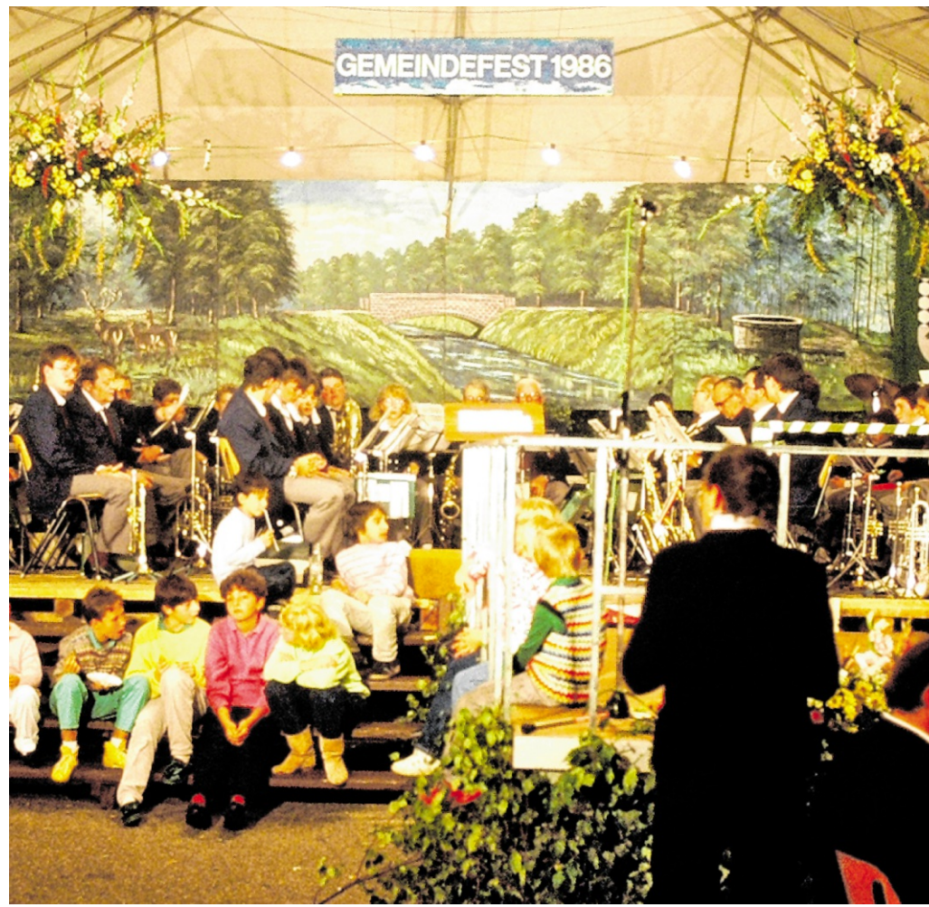
Im zweiten Film des Dorfabends wird ein Blick auf das Offersheimer Gemeindefest aus dem Jahr 1986 geworfen.

Neben den erwähnten Umzügen enthält auch der Film von 1986 zahlreiche seltene Szenen aus dem damaligen Jubiläumsprogramm im Festzelt. Produziert wurde dieser Film von einem professionellen Unternehmen, dessen Name heute allerdings nicht mehr bekannt ist. Auch hier war die Gemein-