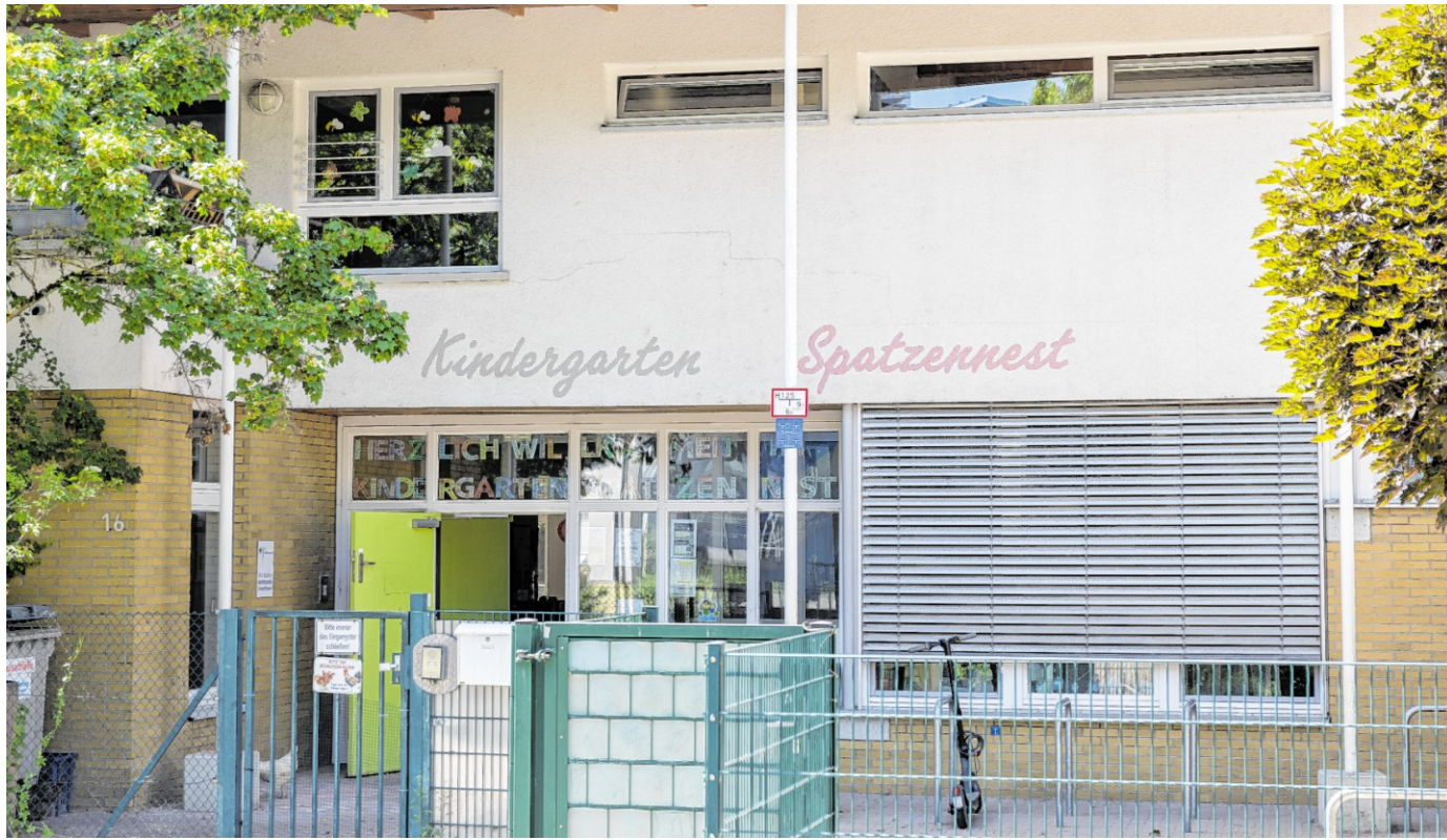
Der Kindergarten Spatzennest feiert Jubiläum.