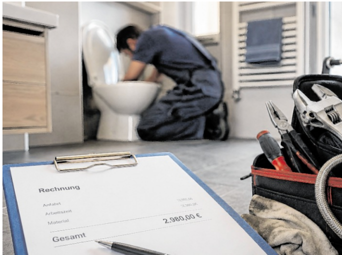
In Schwetzingen ist eine 62-Jährige von einer vermeintlichen Rohrreiner-Firma betrogen worden.

Verbraucher sollten nach Möglichkeit nicht den ersten Anbieter beauftragen, der in einer Suchmaschine erscheint.