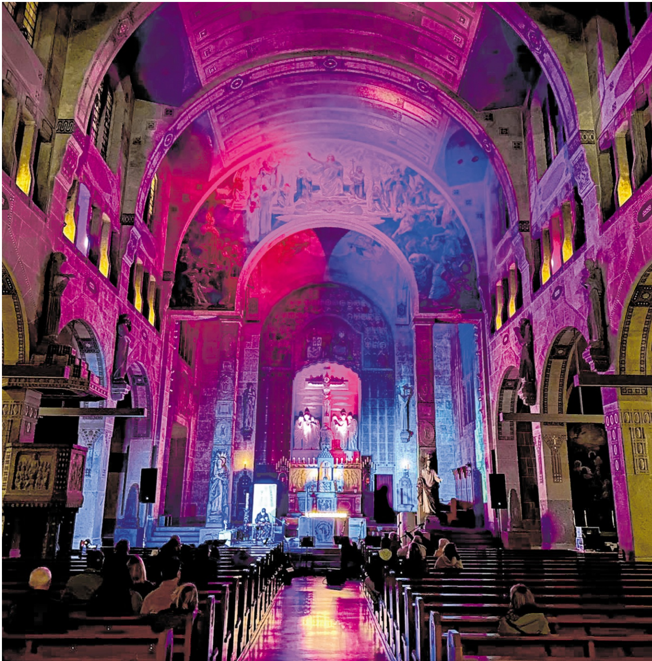
Katholische Kirche St. Georg: An vielen Spielstätten gibt es bei der Hockenheimer Nacht der Musik wieder Kultur pur.