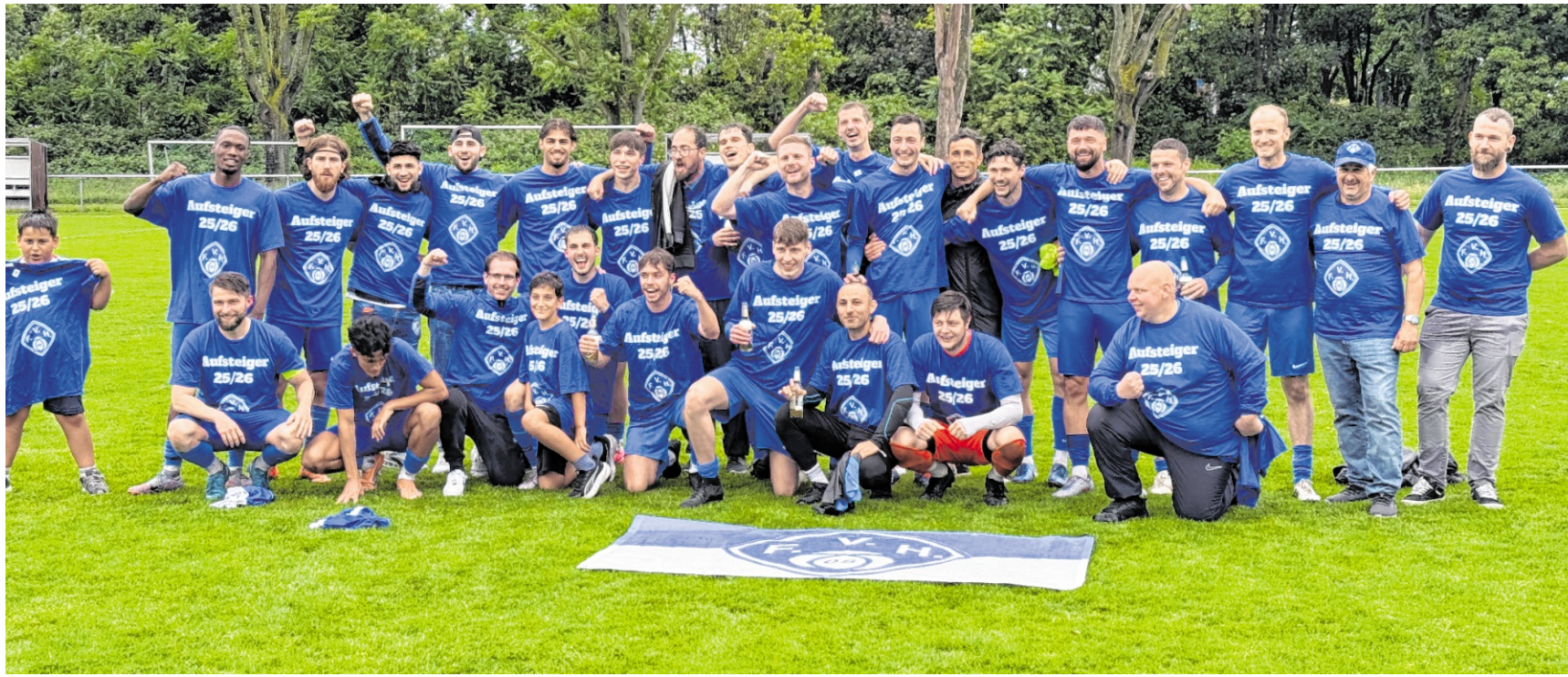
Die Hockenheimer sichern sich im Relegationsspiel mit großem Einsatz und starker Moral den Aufstieg in die Kreisliga.