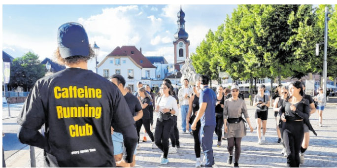
Die „Anfänger“ machten sich in gemächlichem Tempo auf die 3-Kilometer-Strecke rund um den Schlosspark.

Die Sieben-Kilometer-Läufer bogen vom Maschinenweg rechts ab, joggten durch das Kleine Feld, um die Kräutergärten herum bis zur ICE-Trasse sowie die L599 entlang bis zur mittleren Strecke und zurück zum Schlossplatz. 250 Läufer fanden sich nach Schätzung Sockolls auf dem Schlossplatz ein. Einige Minuten später starteten sie auf die drei Strecken, eingeteilt in „Tempogruppen“, um jedem Teilnehmer die Möglichkeit zu geben, ganz nach individueller Fitness gemeinsam mit anderen zu laufen. Zurück am Ausgangspunkt lockten kleine Wraps und Ingwer-Shots sowie Aperol und Longdrinks, um den Teilnehmern die zurückliegenden Läufer nochmals in Erinnerung zu rufen. mgw