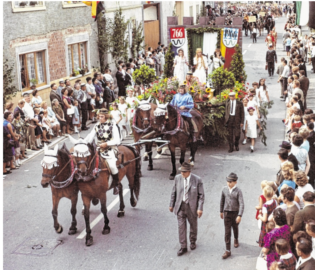
Einer der Filme beim Dorfabend in Offersheim blickt auf den Festzug im Jahr 1966.

deverwaltung Offersheim Auftraggeber der Aufnahmen.