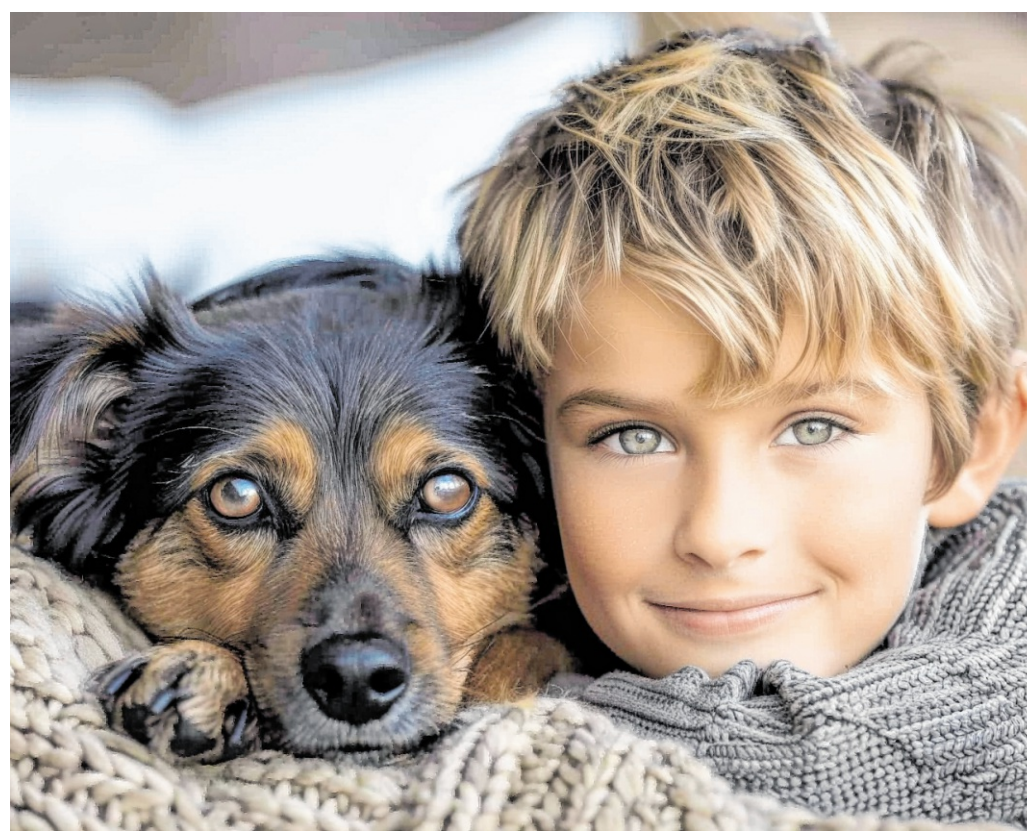
Beste Freunde: Mit einer Immuntherapie lässt es sich gegen eine Tierhaarallergie angehen.

„Das Wichtigste ist zu wissen, dass man eine Immuntherapie, die früher Desensibilisierung genannt wurde, auch gegen Tierhaare machen kann“,