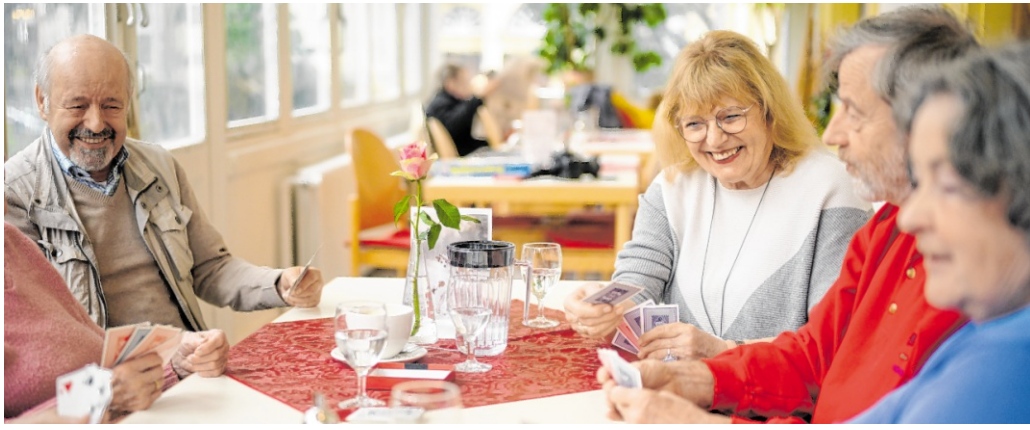
In den Heidelberger Seniorenzentren gibt es Aktivitäten, die Einsamkeit vorbeugen.