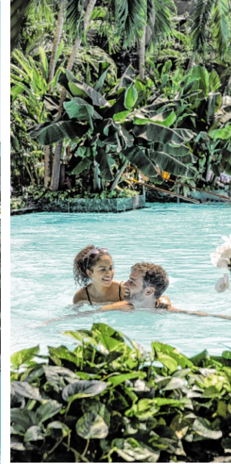
Palmparadies und Lagune: Hier kann man den Sommerurlaub als erholsame und erlebnisreiche Familienzeit genießen.