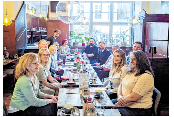
Kaufleute aus der Heidelberger Altstadt kamen beim Händlerfrühstück der Wirtschaftsförderung zum Austausch über die Zukunft der Innenstadt zusammen.

i Eine Übersicht über die Veranstaltungen in den Heidelberger Seniorenzentren bietet die Website www.seniorenzentren-hd.de . Das Programm ist außerdem als Flyer in den Seniorenzentren erhältlich.