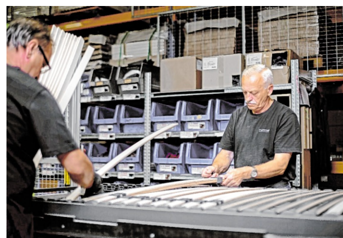
Bei einigen Herstellern werden vielfach noch Matratzen und Lattenroste individuell auf Bestellung gefertigt.

Der Unterschied zwischen bloßem Liegen und echter Erholung ist nicht klein und hat große Auswirkungen. Zu den Gründen für einen unruhigen Schlaf dürfte bei vielen ein mangelnder Schlafkomfort gehören. Während kurzlebige Matratzen schon nach wenigen Jahren ihre Stützkraft verlieren, bieten hochwertige, handgefertigte Produkte langfristige Qualität und die Möglichkeit, das Schlafsystem auf den jeweiligen Körper und dessen Bedürfnisse maßzuschneidern. Bei dem ein oder anderen Matratzenhersteller werden sowohl Matratzen als auch Lattenroste individuell auf Bestellung gefertigt. Die Basis dafür bildet eine Beratung im qualifizierten Bettenfach-