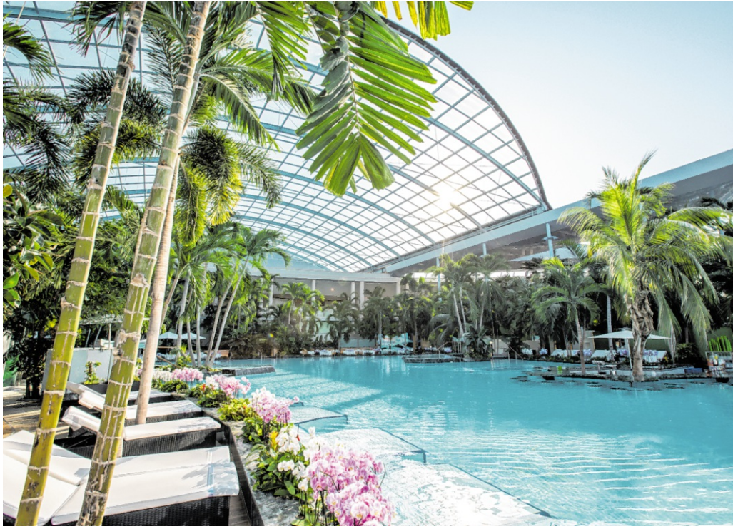
Zwischen dem 27. Juni und 13. September öffnet die Thermen & Badewelt Sinsheim das Palmenparadies und den Paradise Beach für die ganze Familie.

Sinsheim. Der Sommer kündigt sich an – mit langen Abenden, warmen Temperaturen und der Frage, wie die freie Zeit am besten genutzt werden kann. Angesichts gestiegener Sprit- und Flugpreise rückt die Region für viele stärker in den Fokus. Und dabei zeigt sich schnell, wie viel Sommer in der eigenen Umgebung steckt: mit Angeboten, die Musik, Bewegung und entspannte Stunden unter freiem Himmel verbinden. Zum Beispiel beim Thermensommer 2026 in der Thermen & Badewelt Sinsheim. Zwischen Juni und September stehen Open-Air-Konzerte, ein zweitägiges Sommerfest, Surfen auf der künstlichen Welle sowie Angebote für Familien auf dem Programm. Alles an einem Ort und ohne lange Anreise. Hier kommen vier Gründe, warum der Sommer 2026 auch zuhause unvergesslich wird: