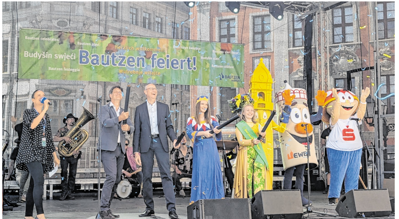
Eröffnung des Stadtfestes Bautzener Frühling mit Heidelberg's Erster Bürgermeister Jürgen Odszuck (2. von links) und Bautzens Oberbürgermeister Karsten Vogt (3. von links).

Neben dem herzlichen Empfang bei den Besuchen im Rathaus, auf dem Stadtfest „Bautzener Frühling“ und bei der Parade zum Stadtfest standen unter anderem eine Führung durch das Museum Bautzen, ein Besuch im Deutsch-Sorbischen Volkstheater und ein Rundgang zum Platz der Partnerstädte auf dem Programm. Dort ist auch Heidelberg mit einer Tafel verewigt.