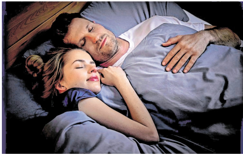
Die passende Grundlage für einen guten Schlaf: Matratzen und Lattenrost sind entscheidend für einen guten Liegekomfort.