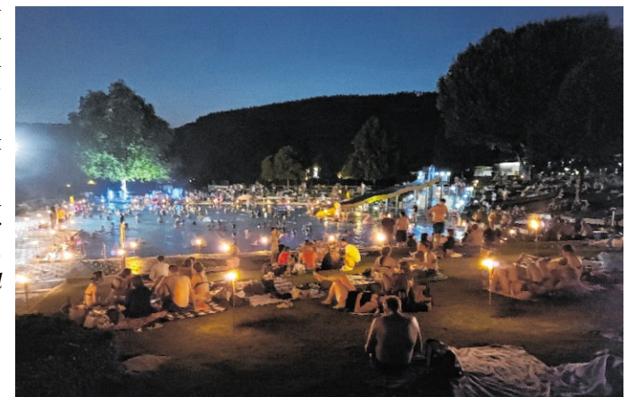
Die Gäste können sich bei der Badenacht im Terrassen-Schwimmbad auf einen stimmungsvollen Abend freuen.

Das Terrassen-Schwimmbad befindet sich in der Schwimmbadstraße 26 in 69151 Neckargemünd. Die Veranstaltung ist witterungsabhängig und kann kurzfristig abgesagt werden. red