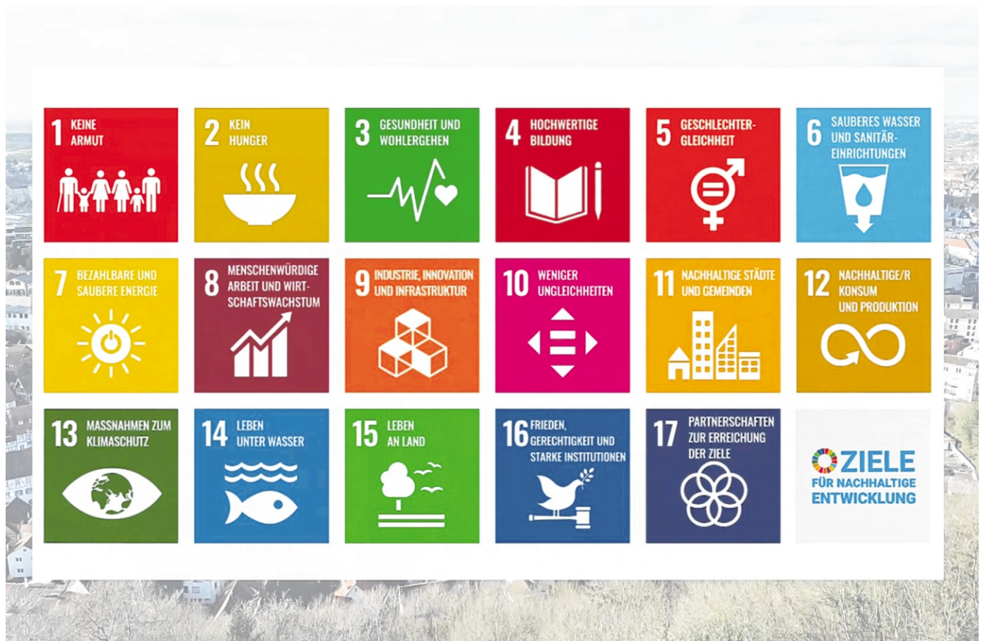
Weinheims Erster Bürgermeister Andreas Buske hat gemeinsam mit dem Presse- und Medienteam der Stadtverwaltung eine Kampagne zu den 17 Nachhaltigkeitszielen der UN gestartet. Dazu sind 17 kurze Videos mit Akteuren aus der Stadtgesellschaft für die Sozialen Netzwerke entstanden.

Besonders zuversichtlich blickt der Verein auf die kommenden musikalischen Höhepunkte, bei denen die Chöre voraussichtlich zu hören sein werden: am 13. Juni beim Weststadtfest Ahornstraße, am 21. Juni bei der Fête de la Musique in Weinheim, am 27. Juni bei der Singenden Altstadt Heidelberg, am 5. Juli beim Internationalen Kulturfest im Schlosshof und am 24. Oktober beim Italienischen Abend im