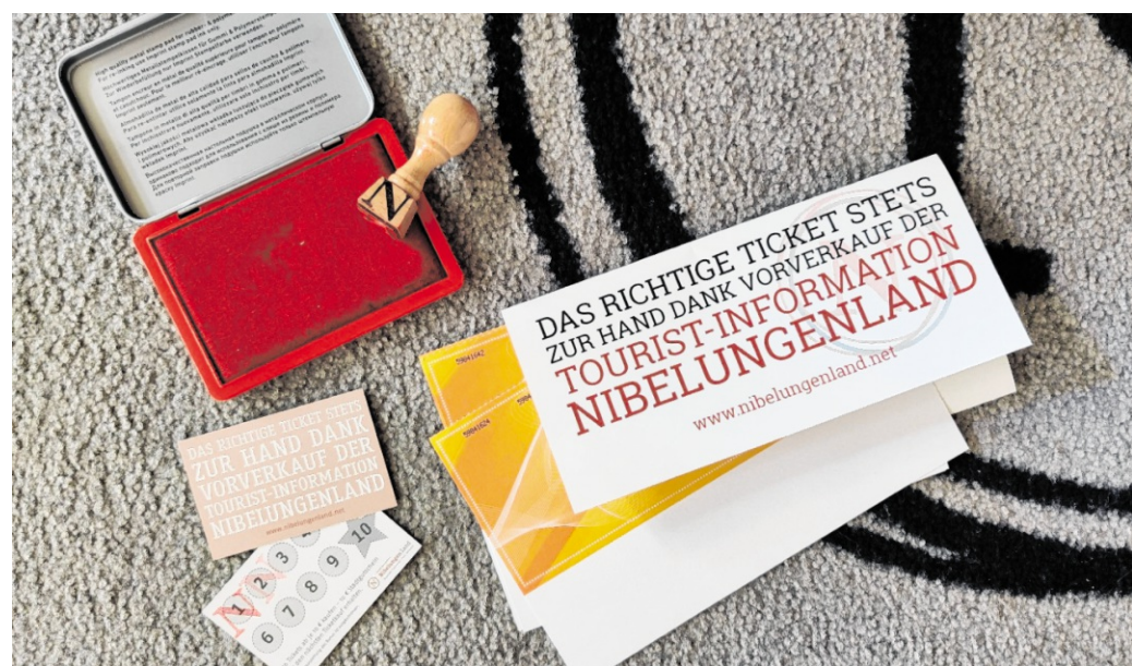
Mit der Einführung der Bonuskarte setzt die Tourist-Information einen weiteren Anreiz, Tickets direkt vor Ort zu erwerben. Zugleich stärkt sie den lokalen Servicegedanken.

Für jedes Veranstaltungsticket im Wert von mindestens zehn Euro wird ein Stempel auf der Bonuskarte vergeben. Beim Kauf mehrerer Tickets erhöht sich die Anzahl der Stempel entsprechend, pro Ticket wird ein Stempel vergeben. Davon profitieren insbesondere Kunden, die mehrere Veranstaltungen besuchen oder Tickets für verschiedene Events erwerben. Ist die Bonuskarte mit zehn Stempeln gefüllt, erhalten die