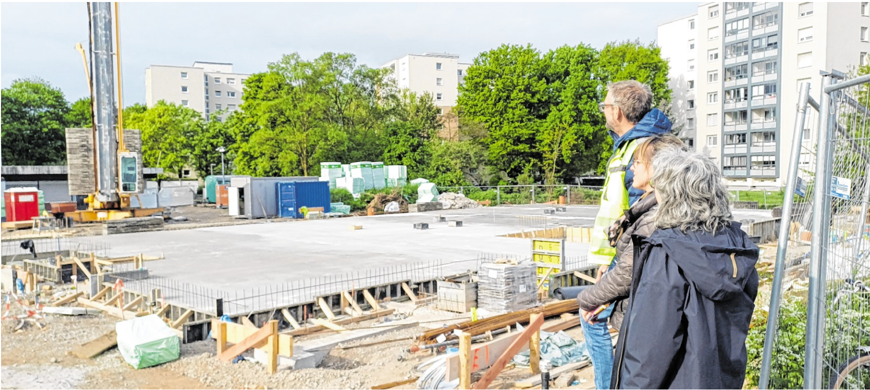
Die Kita Kuhweid wird in nachhaltiger Bauweise errichtet und soll im Herbst Richtfest feiern.