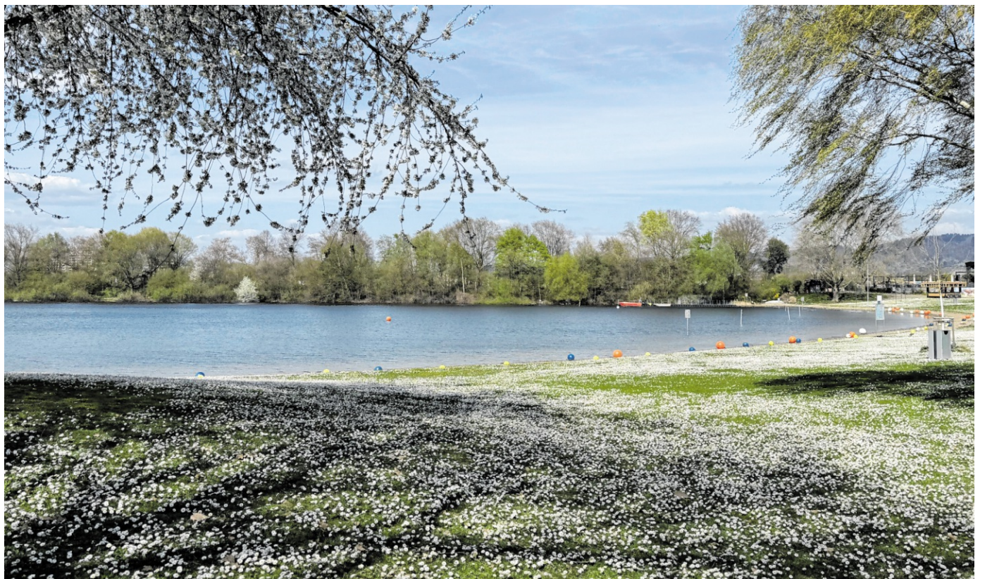
Blick auf das Strandbad Waidsee in Weinheim, wo die Eintrittspreise zur neuen Saison leicht steigen.