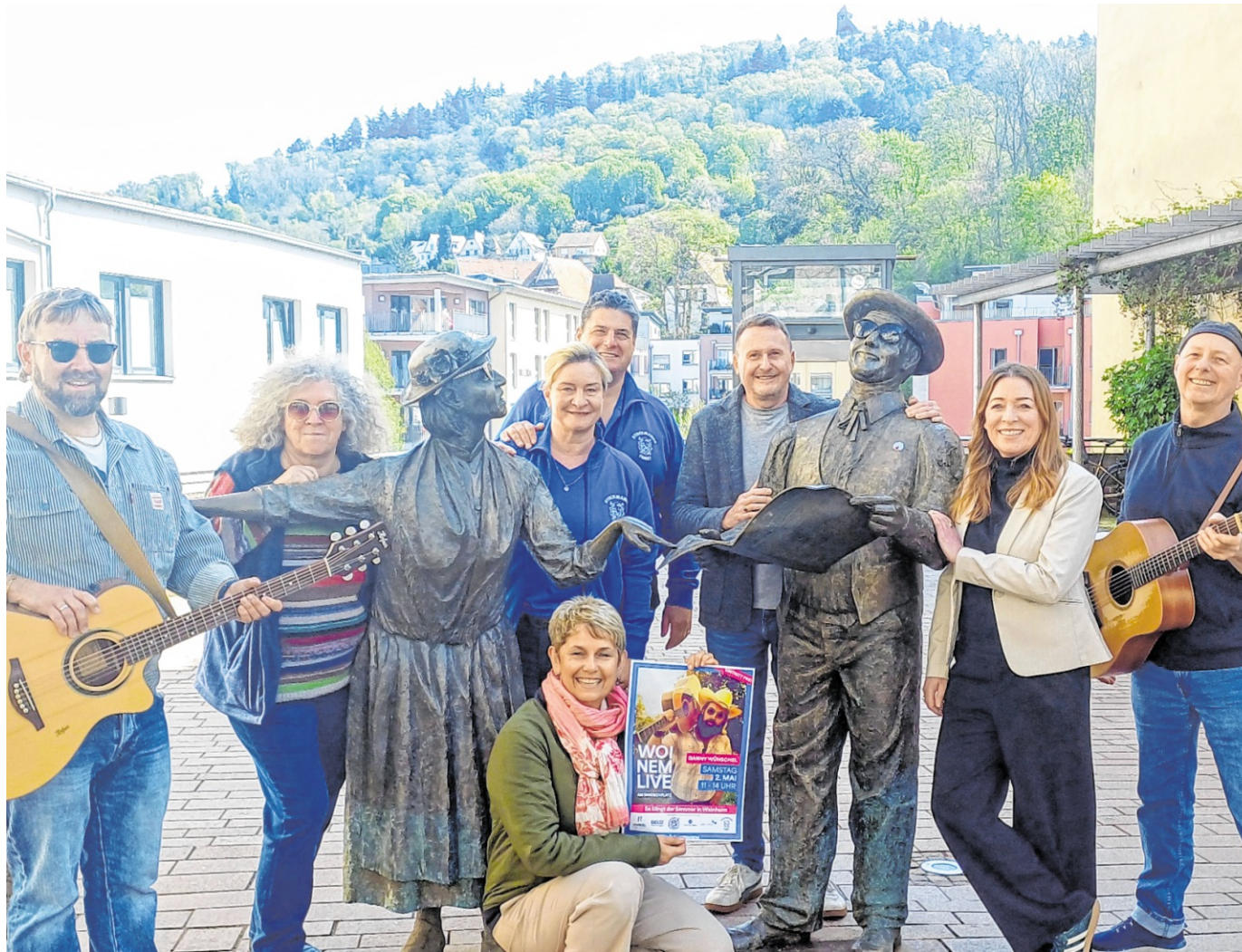
Die Akteure von „Woinem Live am Windeckplatz“ stellten das Programm der fünften Saison in Weinheim vor.