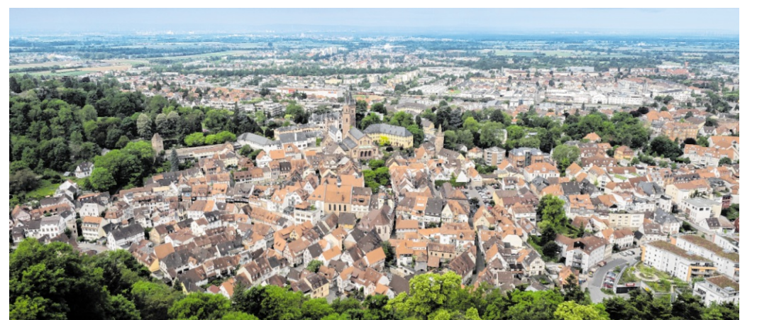
Stadtentwicklung: Mit einem Förderprogramm sollen Daten zu Baulücken, Leerstand und Schrottimmobilen aktualisiert werden.

Bereits im Zuge der letzten Teilnahme wurde ermittelt, dass es in Weinheim rund 319 klassische Baulücken oder baulückenhähnliche Teilflächen gibt, die eine Fläche von etwa 16,6 Hektar umfassen. Wie groß dieses Areal ist, zeigt ein Vergleich mit dem Geltungsbereich des Bebauungsplanes Allmen-