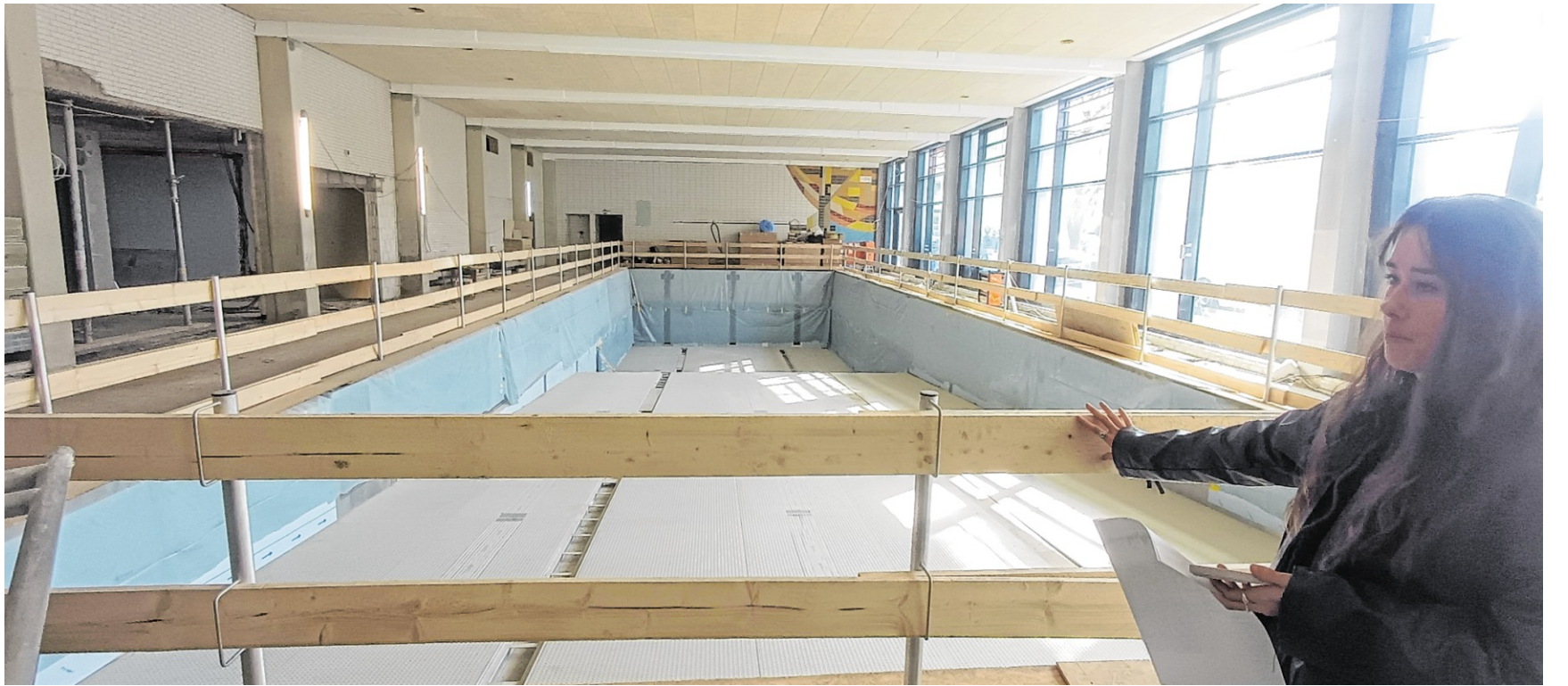
Das Victor-Dulger-Hallenbad in Hohensachsen soll im September eröffnen und erhält eine moderne Wasser- und Energietechnik. Eine Photovoltaikanlage mit 100 Kilowatt/Peak und Wärmepumpen sollen das Bad weitgehend klimaneutral versorgen.

Das Team Technik mit Dr. Gustav Trilsbach und Fabian Reiser setzte Bühne und Künstler ins passende Licht und sorgte für gute Akustik. Die Besucher spendeten Applaus, und die beiden Künstler bescheinigten dem Verein: „Es war uns eine große Freude.“