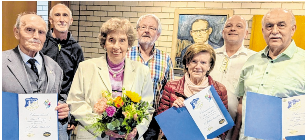
Der Gesangverein 1955 Weinheim blickte bei seiner Jahreshauptversammlung auf ein bewegtes Jahr mit intensiver Probenarbeit, zahlreichen Auftritten und wichtigen Weichenstellungen zurück. Besonders gewürdigt wurden langjährige Mitglieder sowie die musikalische Entwicklung der Chöre.