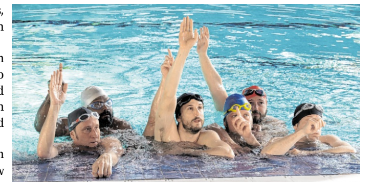
Am Freitag, 8. Mai, läuft im Olympia-Kino die Komödie „Ein Becken voller Männer“.

Die Veranstaltung findet am Freitag, 8. Mai, statt. Einlass ist ab 19 Uhr, Filmbeginn gegen 20 Uhr. Der Eintritt beträgt 16 Euro für Film, fruchtigen Cocktail, auch alkoholfrei, und süßes Kinohupferl. Um besser planen zu können, bittet das Kino um Kartenkauf bis zum 4. Mai. Dies kann online über die Kino-Homepage www.olympia-leutershausen.de geschehen oder an der Kinokasse zu den üblichen Öffnungszeiten. Beim Online-Kauf fallen Gebühren an, beim Kauf an der Kinokasse nicht. red