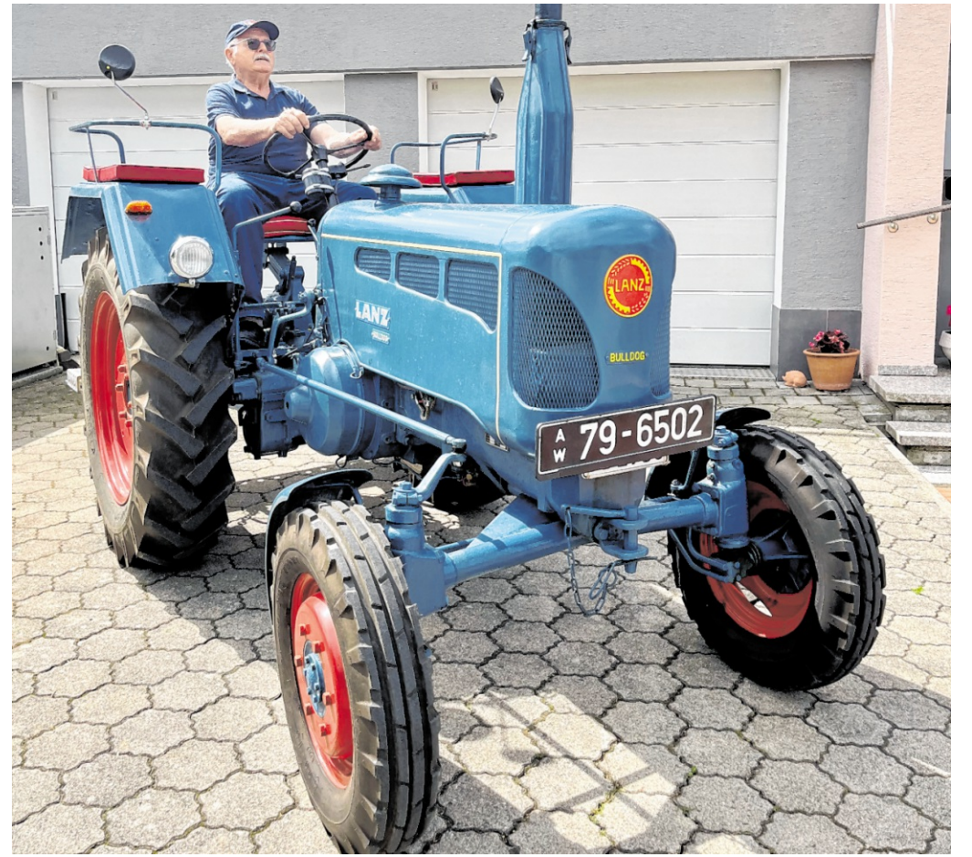
Am 5. Juni 1956 erhielt der Bulldog das Kennzeichen AW 79-6502, was Amerikanische Zone Württemberg, bedeutete.

Am Morgen des 16. Mai ließ es schließlich Abschied nehmen. Nach einem gemeinsamen Frühstück mit der Epping Forest Band wurden noch einmal Erinnerungen ausgetauscht, Kontakte vertieft und bereits erste Pläne für ein Wiedersehen geschmiedet. Nach dem Rückflug und dem Bustransfer zurück nach Eppingen ließen einige Teilnehmenden die Reise bei einem gemeinsamen Abendessen ausklingen, ehe schließlich auch der Transporter ausgeladen und alles wieder verstaut wurde. ug/ske