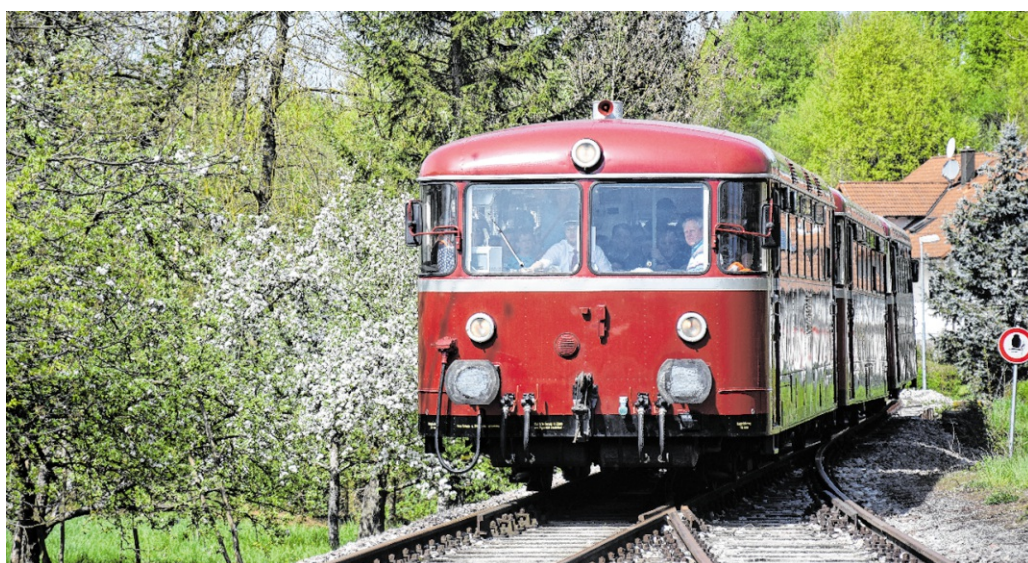
Mit einer Höchstgeschwindigkeit von 60 Stundenkilometern fährt der historische Triebwagen der Krebsbachtalbahn auf 17 Kilometern durch das nördliche Kraichgauer Hügelland.

Historische Bahn, große Natur Namensgeber ist der kleine Krebsbach, der die Bahn bis Obergimpfern begleitet und für romantische Fotomotive sorgt. Die Fahrt ist ein Genuss für alle Naturliebhaber, denn das Krebsbachtal führt durch große Wälder und sanfte Hügel. Entlang der Strecke laden gut aus-