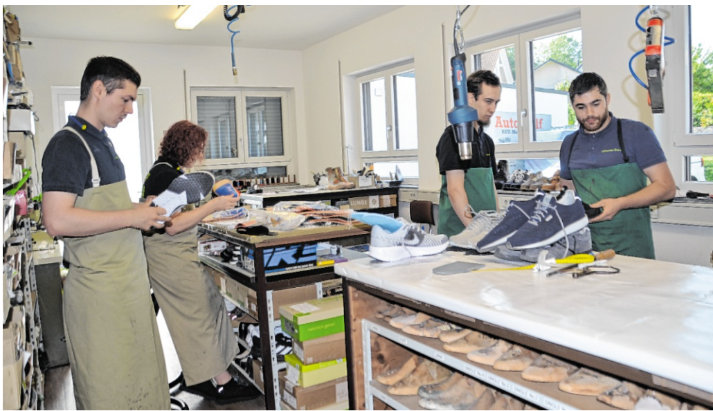
Insgesamt zehn Fachkräfte sind bei Haaß Orthopädie-Schuhtechnik für das Wohl der menschlichen Füße tätig.