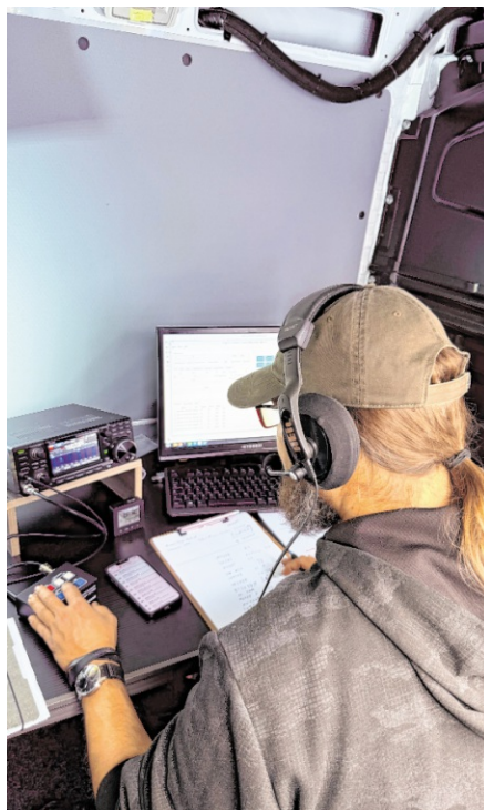
Am ersten Juniwochenende erleben Besucher am U-Boot U17 weltweite Funkkontakte in Echtzeit.

Die Veranstaltung knüpft an den erfolgreichen Auftakt im vergangenen Jahr an. Bereits 2025 wurde unmittelbar nach der feierlichen Eröffnung des U-Boots U17 erstmals im Rahmen des internationalen Funkwochenendes gefunkt. Aufgrund der