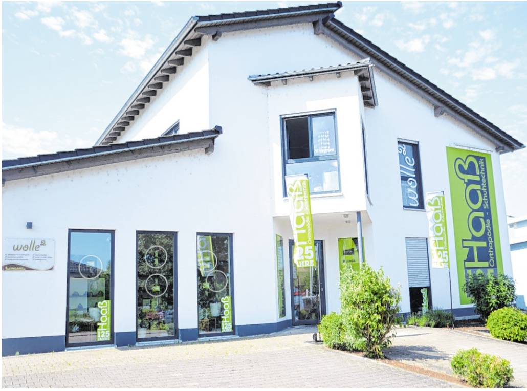
Blick auf das heutige Firmenanwesen von Haaß Orthopädie-Schuhtechnik im Meisenweg 6 in Angelbachtal.

Ein Blick in die Werkstatt zeigt, wie viel handwerkliche Präzision und Erfahrung hinter jedem einzelnen Produkt steckt. Viele Arbeitsschritte erfolgen bis heute in sorgfältiger Handarbeit. Gleichzeitig kommen moderne Technologien wie digitale Fußscanner und innovative Vermessungssysteme zum Einsatz, um passgenaue und individuelle Lösungen für die Kunden zu schaffen. Diese Kombination aus Tradition und Moderne prägt die Philosophie des Unternehmens seit vielen Jahren. Nicht nur die hohe fachliche Kompetenz, sondern auch die