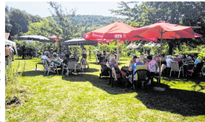
Impressionen zum anstehenden Sommerfest des OGV Dühren.

Bereits zwei Tage zuvor, am Freitag, 19. Juni, haben die Street Food Fighter ihr Kommen zugesagt, die gemeinsam