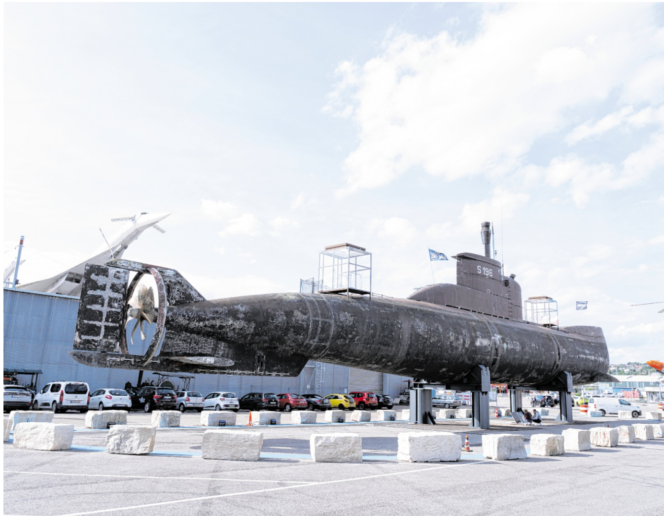
Gäste könne selbst funkten und mit Amateurfunkern sowie ehemaligen U-Boot-Funkern ins Gespräch kommen.

Telefon: 07261/ 976 386 E-Mail: ugross-redaktion@t-online.de