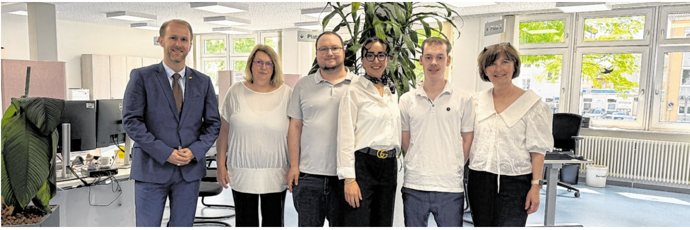
Team des Bürgerbüros mit Oberbürgermeister Marco Siesing.