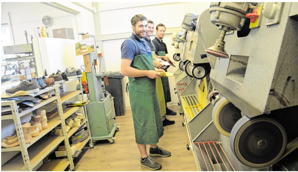
Zur Fertigung von Einlagen und orthopädischen Schuhen stehen den ausgebildeten und kompetenten Mitarbeitern hochwertige Maschinen zur Verfügung.