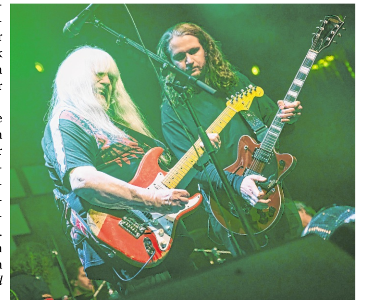
„The Sweet“ spielen am 27. April nächsten Jahres in Sinsheim.

Karten gibt es in Sinsheim bei der Buchhandlung J. Doll, Reise Ecke Beck, sowie in allen bekannten Vorverkaufsstellen und online unter www.kultopolis.com/ .