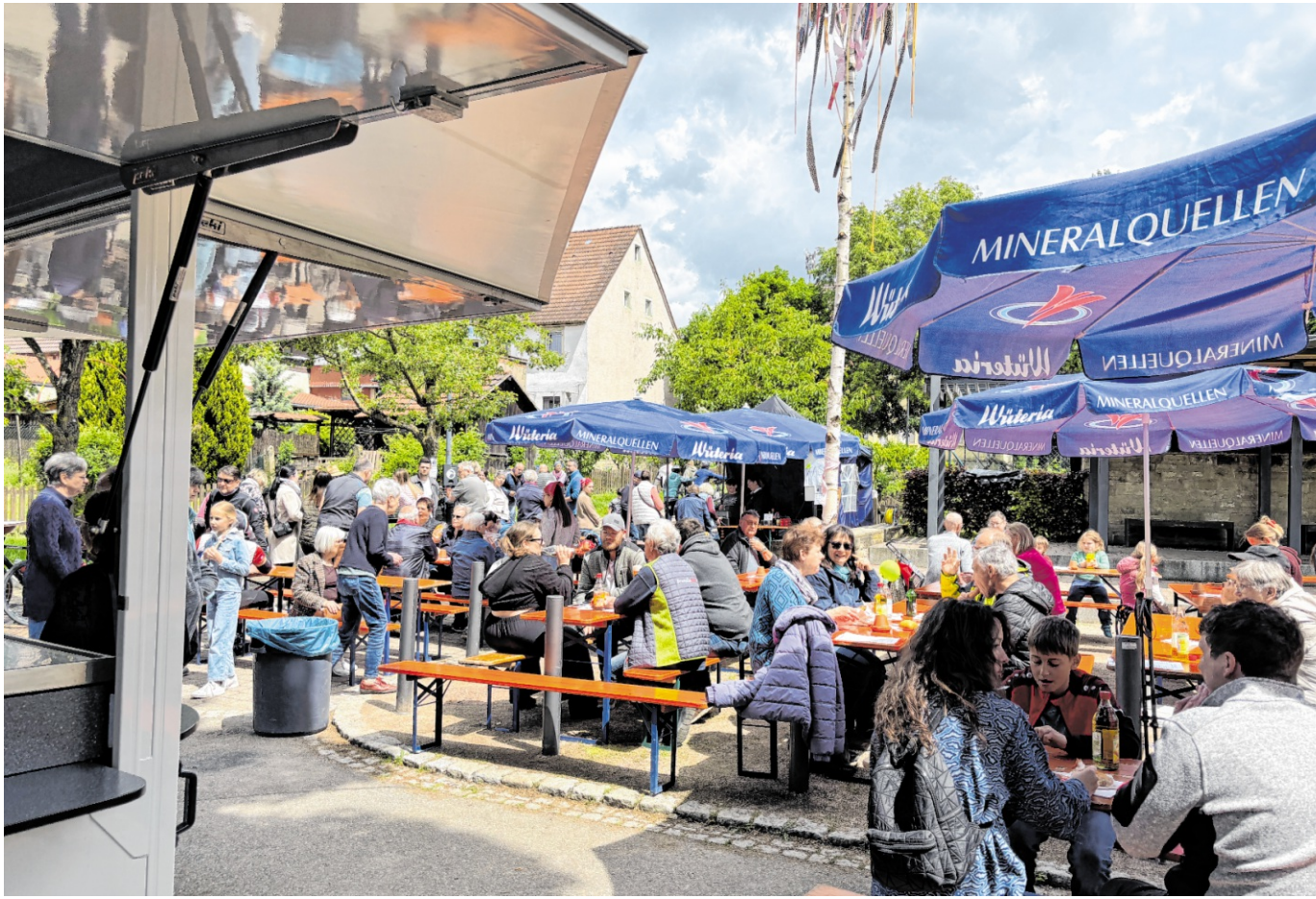
Viele Besucher kamen zum Festwochenende in Richen mit Konzertabend und Floh- und Handwerkermarkt.