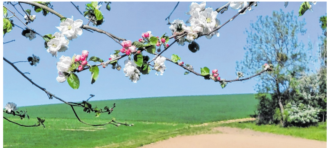
Zarte Apfelblüten leuchten am Radweg zwischen Hilsbach und Waldangeloch.

Angelbachtal. Auf einer Mai-Radtour zwischen Hilsbach und Waldangeloch bot sich Adolf Quast ein besonders reizvoller Anblick: Entlang des Radwegs entfaltet Apfelbäume ihre üppige Blütenpracht und setzten leuchtende Akzente in die frühlingshafte Landschaft. Vor dem strahlend blauen Himmel kamen die zarten weißen und rosafarbenen Blüten besonders eindrucksvoll zur Geltung und verliehen der Szenerie eine fast schon idyllische Leichtigkeit.