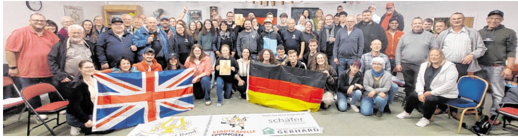
Städtepartnerschaft: Die Stadtkapelle Eppingen erlebte in Epping vier Tage.

GELEBTE EPPINGER STÄDTEPARTNERSCHAFT: Vier unvergessliche Tage erlebt.