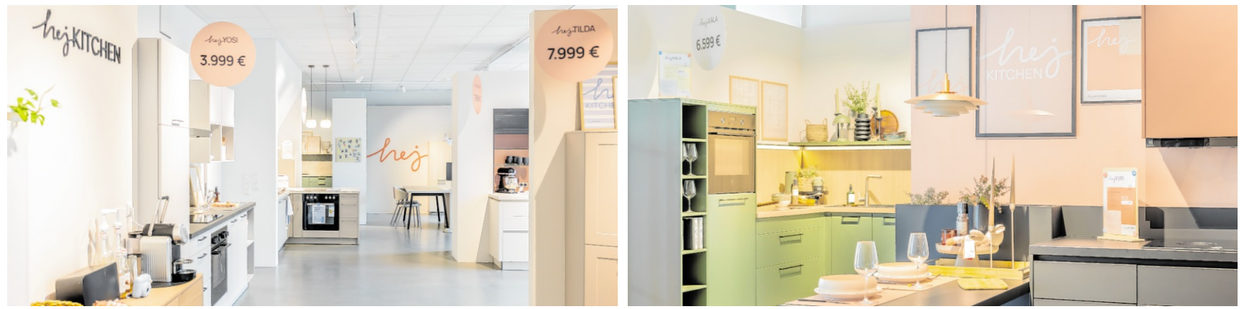
Aktuell: Beim Kauf einer Küche sind ausgewählte Elektrogeräte im Preis inklusive.