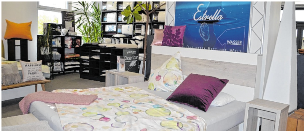
Zu den hochwertigen Betten wird auch die passende Bettwäsche, Matratzen und alles was zum Sortiment gehört, angeboten.

Zudem wird eine beliebte Tradition fortgeführt: Der jährliche Walldorfer Apfeltag auf dem Gelände im Kleinfeldweg 52 findet weiterhin statt. In diesem Jahr, am 5. September, dürfen sich Besucher wieder auf regionale Vielfalt und geselliges Miteinander freuen.