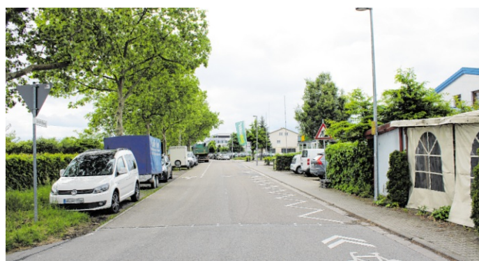
Im Kleinfeldweg in Walldorf wird eine Fahrradstraße für drei Monate erprobt.

Walldorf. Der Kleinfeldweg wird für drei Monate zur Fahrradstraße. Den Verkehrsversuch hat der Gemeinderat mehrheitlich beschlossen. Ziel ist, so Stadtbaumeister Andreas Tisch, Erkenntnisse für eine dauerhafte Lösung auf der wichtigen Route zwischen Bahnhof und Gewerbegebiet zu gewinnen, um die Sicherheit und Attraktivität für den Radverkehr zu erhöhen.