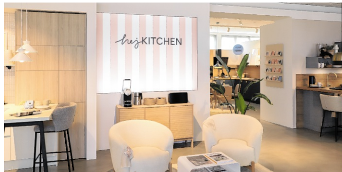
Die Stores in Landau, Bruchsal, Walldorf und Heidelberg bieten Küchenplanung in stilvollem Ambiente.

Gemeinsam mit dem starken Partner Möbel Ehrmann verfolgt Hej Kitchen ein klares Konzept: moderne Küchen für jedes Budget – persönlich geplant, hochwertig umgesetzt, mit attraktiven Aktionsvorteilen kombiniert. Bereits ab 3.499 Euro erhalten Kundinnen und Kunden individuell geplante Küchen, die Design, Alltagstauglichkeit und Qualität verbinden. „Gerade junge Familien wünschen sich heute