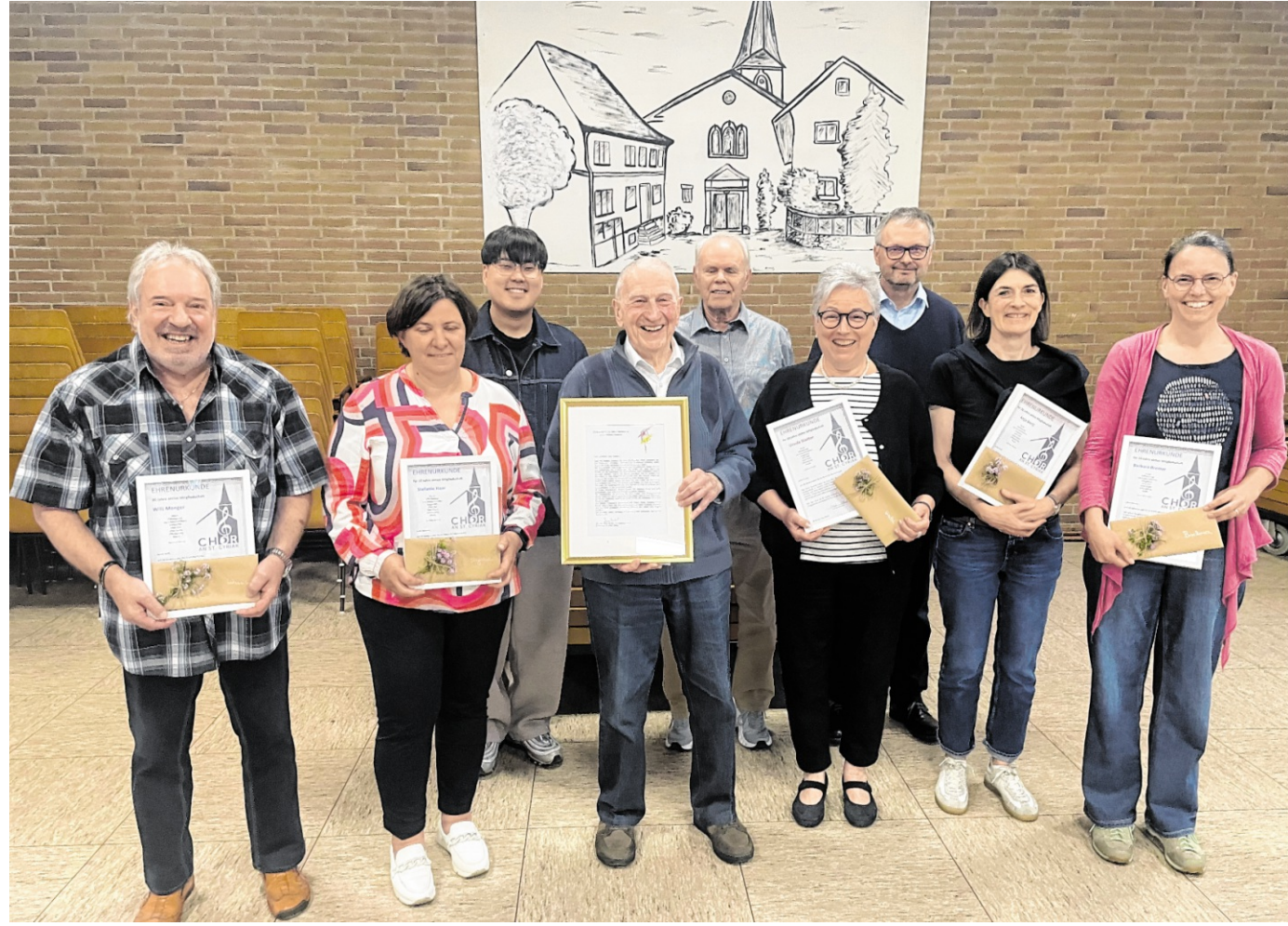
Jahrzehntelanges Singen, starke Präsenz und ein einstimmiges Votum prägten die Jahresversammlung des Kirchenchores.