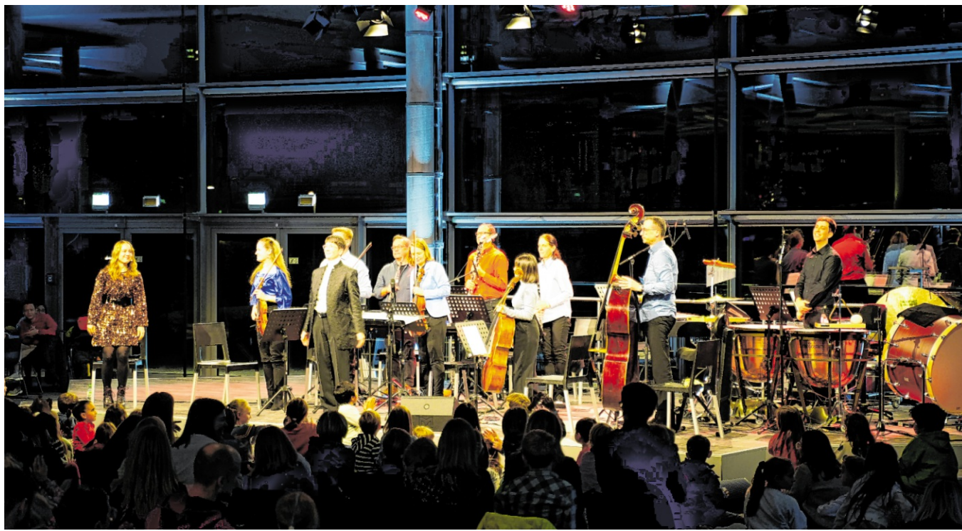
Das SAP Sinfonieorchester gibt am 7. Juni auf dem Heidelberger Schloss ein Konzert.

Telefon: 0621/ 392 2814 E-Mail: crink@haas-publishing.de