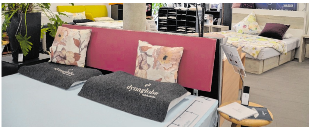
Impressionen von den hochwertigen Betten nebst Zubehör bei Gröner in Walldorf.