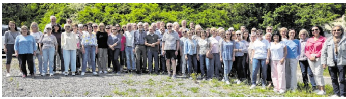
Der Chor Constantia Walldorf bereitet sich bei einem Probenwochenende in Wolfstein auf die Show „Constamania“ vor.

Walldorf. Einige Chormitglieder der Constantia Walldorf fragten sich bei ihrer Ankunft in der Jugendherberge Wolfstein: „Wo sind wir hier?“ Durch die großen Fenster des Speiseraums fiel der Blick auf eine beeindruckende Landschaft. Taunus? Hunsrück? Nicht ganz: Wolfstein liegt im westpfälzischen Bergland. Dort zogen im 19. Jahrhundert viele Wandermusikanten in die Welt, um mit ihrer Musik ihren Lebensunterhalt zu verdienen – ein passender Ort also, um sich auf die Constantia-Show „Constamania“ – Die Rock Classic Show im November vorzubereiten. Dank guter