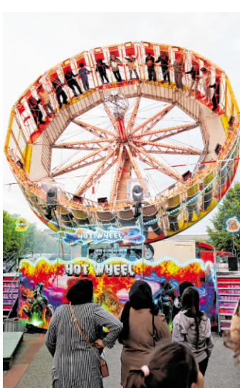
Die Innenstadt wird zur Erlebnismeile.

Der Samstag, 13. Juni, steht ganz im Zeichen von Musik, Kultur und Familienprogramm. Auf dem Marktplatz präsentieren sich unter anderem der Deutsch-Chinesische Freundeskreis, der Zirkus Payaso der SG Astoria sowie die Kinder-