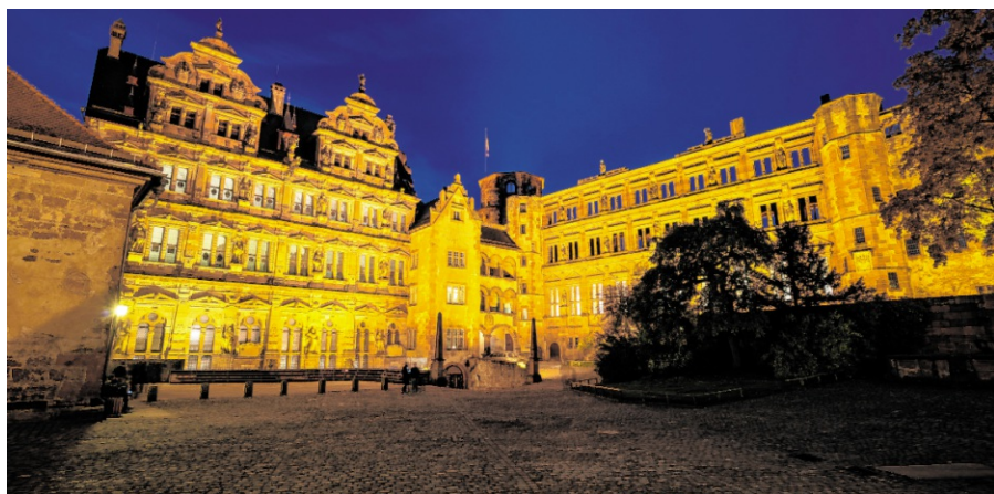
Eine würdige Kulisse: Das Schloss Heidelberg.

HEIDELBERG: Charity-Crossover-Konzert „Heaven is a Place on Earth“ lockt am 7. Juni.