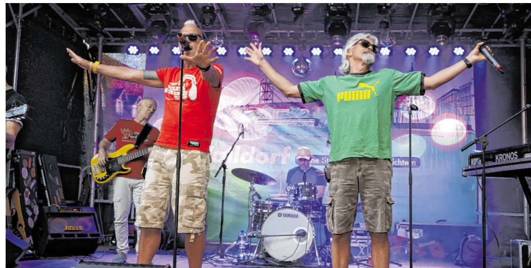
Vereine, Bands, Straßenmusik und Mitmachangebote machen den Spargelmarkt zum Treffpunkt für die ganze Stadt.

Beim Abverkauf werden hochwertige Betten, Wasser- und Luftvitalbetten dynamische sowie sortimentserweiterte Produkte und Inventar zu Schnäppchenpreisen angeboten. Alles muss raus. Der Abverkauf läuft von bis Samstag, 27. Juni (letzter Öffnungstag).