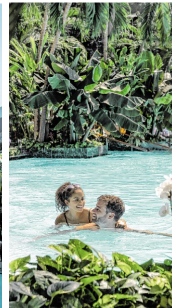
Palmparadies und Lagune: Hier kann man den Sommerurlaub als erholsame und erlebnisreiche Familienzeit genießen.

Zwischen dem 27. Juni und 13. September öffnet die Thermen & Badewelt Sinsheim das Palmenparadies und den Paradise Beach für die ganze Familie. Während Erwachsene zur Ruhe kommen und entspannen, erleben Kinder Spiel, Spaß und Abenteuer bei kreativen Mitmachaktionen, wie DIY-Basteln oder spielerischen