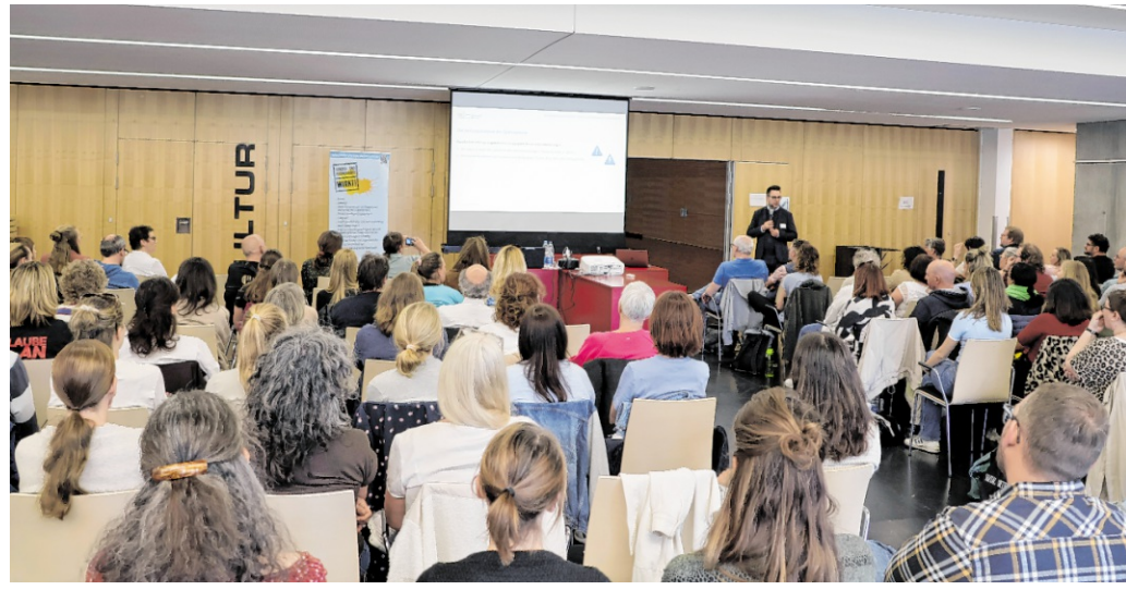
Die Jahrestagung der Schulsozialarbeiter im Kreis ging in der Astoria-Halle über die Bühne.

! Weitere Informationen sowie die Möglichkeit zur Anmeldung finden sich unter www.technik-museum.de/tuning-treffen .