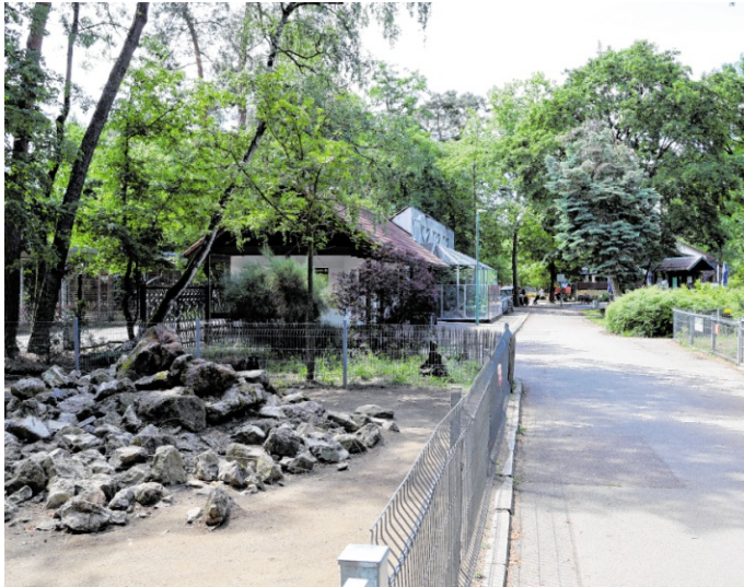
Der Tierpark wird Schritt für Schritt neu gestaltet. Alle Interessierten können dazu jetzt an einer Umfrage teilnehmen.