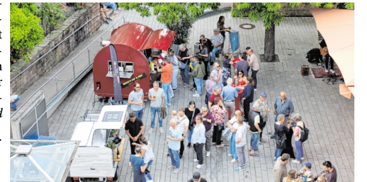
Das dritte After-Work-Event findet am 18. Juni auf dem Marktplatz statt.

Low“, heimische und indische Spezialitäten, Cocktails sowie einen Stand mit einem Kinderprogramm. Die After-Work-Events möchten mit Musik, Genuss und guter Gesellschaft den passenden Rahmen bieten, den Feierabend in entspannter Atmosphäre zu genießen. Weitere Veranstaltungen sind für 16. Juli und 13. August ebenfalls auf dem Marktplatz geplant. red