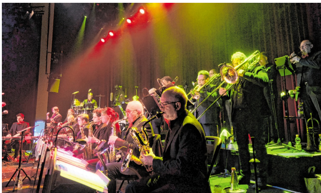
Den Auftakt der Konzertreihe gestaltet die „BigBand im Quadrat“.

Ab 16. Juni erwartet die Besucher immer dienstags um 18.30 Uhr ein abwechslungsreiches musikalisches Programm im Ambiente des Gerbersruh-parks. Der Eintritt zu allen Konzerten ist frei. Stattdessen kann die Wertschätzung freiwillig in einer Spendenbox hinterlassen werden. Ganz bewusst wird auf Eintrittsgelder verzichtet, damit alle Bürger die Möglichkeit haben, Teil dieser besonderen Konzertreihe zu sein. Den Auftakt am Dienstag, 16. Juni, ge-