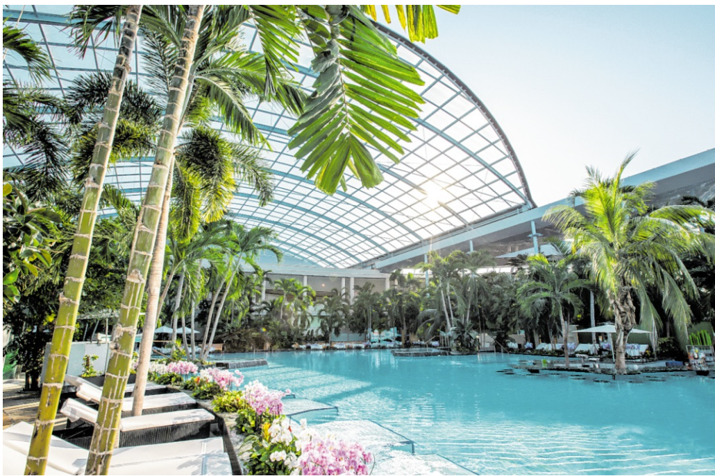
Zwischen dem 27. Juni und 13. September öffnet die Thermen & Badewelt Sinsheim das Palmenparadies und den Paradise Beach für die ganze Familie.

staltungskalender: der Sommernachtstraum am 24. und 25. Juli. Beim großen Sommerfest unter Palmen spannt sich der musikalische Bogen von DJ-Beats am Nachmittag bis zur Live-Band in den lauen Abendstunden. Zwei Tage voller Sommerstimmung, Livemusik und purem Urlaubsgefühl in der Heimat.