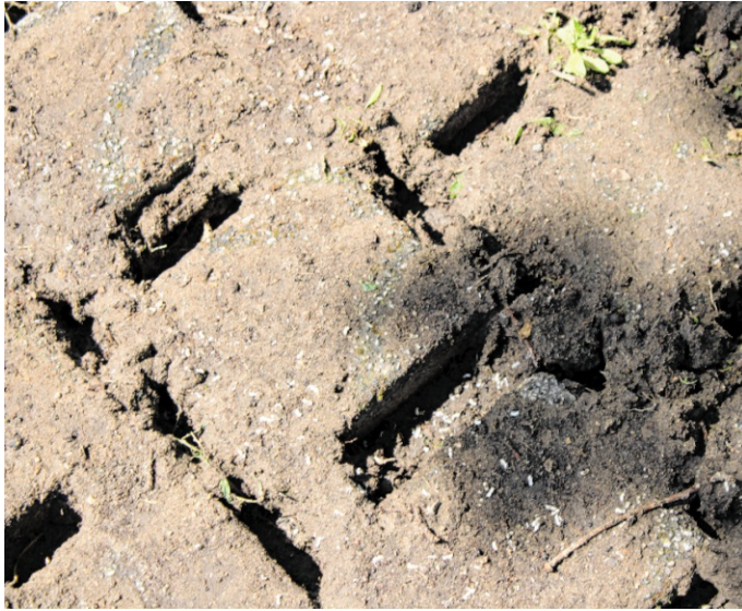
Die Bekämpfung der Großen Drüsenameise mit Heißdampf hat sich als wirkungsvoll erwiesen. Dabei werden auch die weißen Eier zu Tage gefördert.