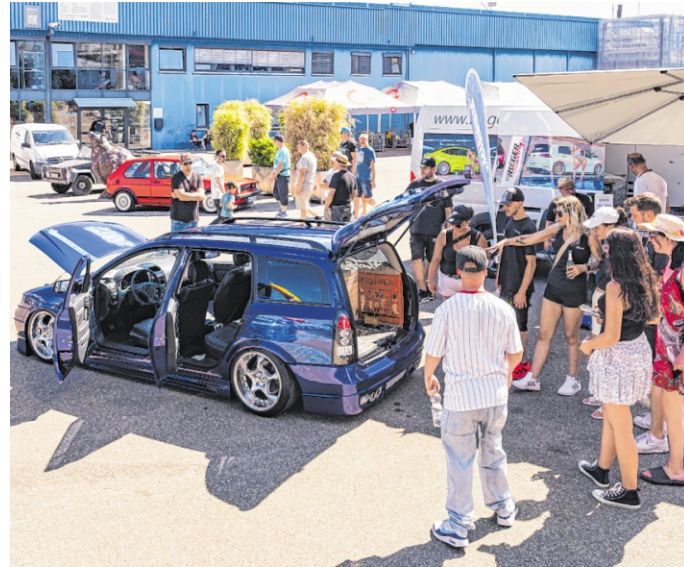
Unterhalb der Concorde und des U-Bootes U17 versammeln sich am Samstag über 100 kreative Umbauten, historische Fahrzeuge und aktuelle Showcars.